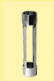
adaptador para soporte de resorte