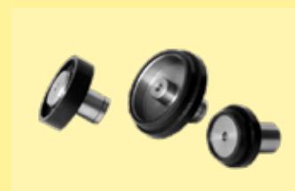
rolos deslizantes para los soportes