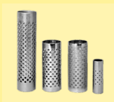
soportes: tubos perforados