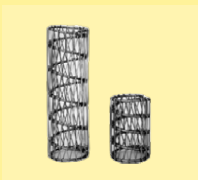
soportes de resorte con alambre