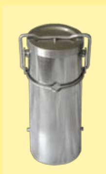
vaso de 1200ml