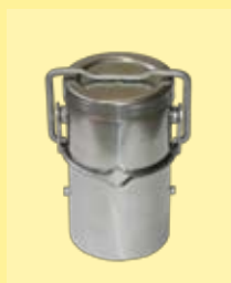
vaso de 500ml