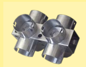
soporte para 8 vasos de 1200ml