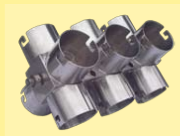
soporte para 12 vasos de 500ml