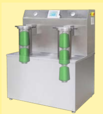
modelo TUB-4-B con 1 hasta 2 conos en cada tanque