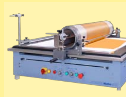
cilindro con lámina de caucho