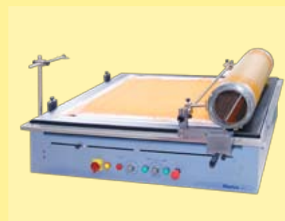
cilindro con barra electromagnética