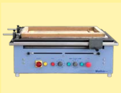
cuadro con barra electromagnética

La aplicación puede ser hecha repetidas veces, en las dos direcciones, ida y vuelta.