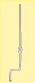
estalagmómetro (de vidrio) para análisis de tensioactivos