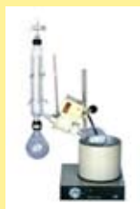
evaporador rotativo para recuperación inodora de solventes