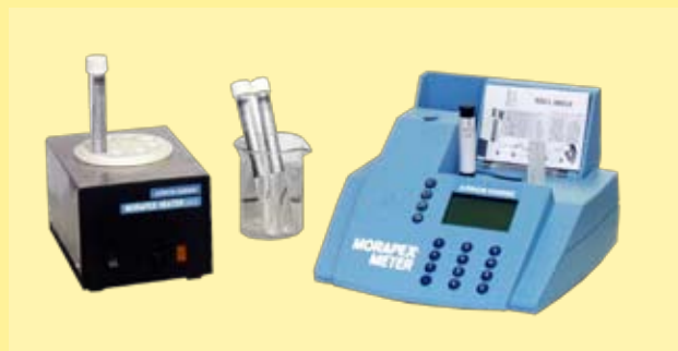
kit para análisis de formaldehído

con conjunto de tubos de ensayo conteniendo químicos (kitA), calentador Morapex Heater (kitB1), y espectrofotómetro de transmisión Morapex Meter (kitB2)