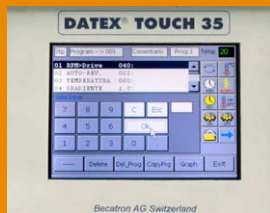
Programación del Controlador

DATEX Touch Screen 35 con pantalla gráfica basado en sistema operacional Windows CE 5.0 con 102 programas de 50 pasos cada