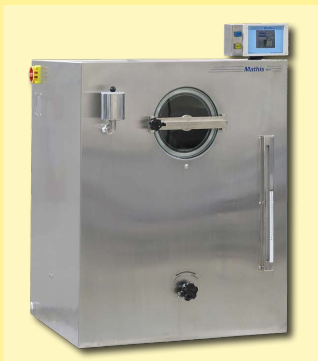
Modelo MTP-I-B para hasta 3 kg de material