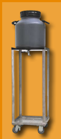
tanque removible 25 litros

tanques de adición para la tina de impregnación del foulard con control de nivel por medio de boya.