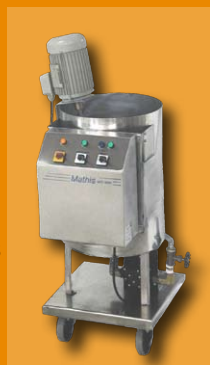
tanque 50 litros con agitador

foulard con ancho de rolos 80 mm y tina de impregnación 15 litros con rolo de inmersión removible que posee aspas para mantener el baño agitado: