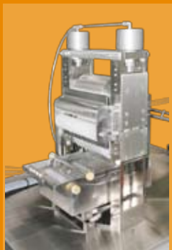
foulard de impregnación con tina calentada