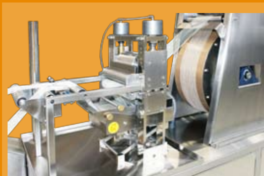
foulard de impregnación con tina calentada