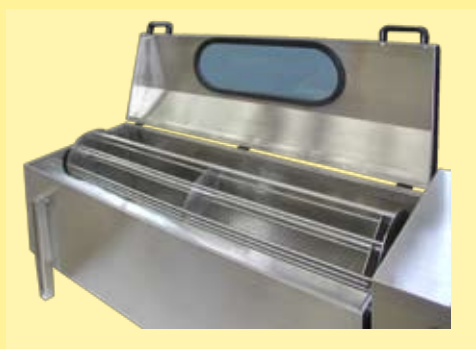
aspa de la barca