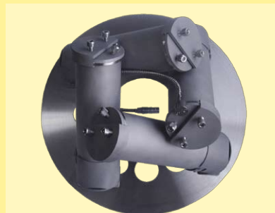
Disco con 4 vasos de 1000ml /1200ml o 1400ml con o sin dosificación