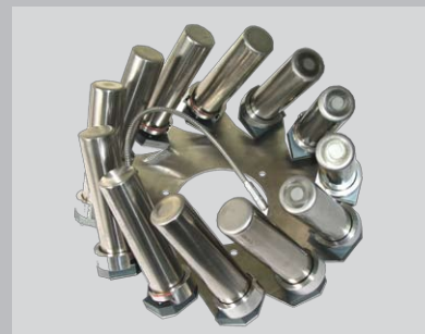
Disco con 12 vasos de 200 / 300ml con o sin dosificación