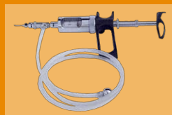
Jeringa de dosificación 5,0 ml