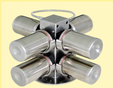
Disco con 8 vasos de 500ml para solidez al lavado