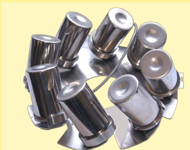
Disco con 8 vasos de 500ml con o sin dosificación