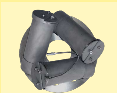
Disco con 3 vasos de 1800ml con o sin dosificación