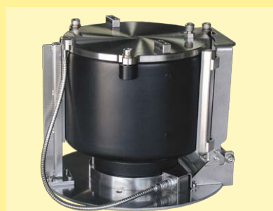
Disco con 1 vaso de 5 litros con o sin dosificación

Gancho para teñido de hilos / madejas en vasos de 100, 200, 300, 500, 1000, 1200, 1400 o 1800ml