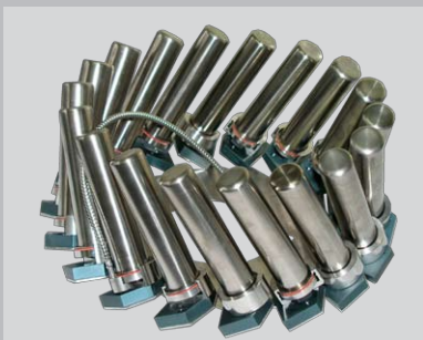
Disco con 18 vasos de 100ml con o sin dosificación