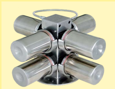
Disco con 8 vasos de 500ml para solidez al lavado