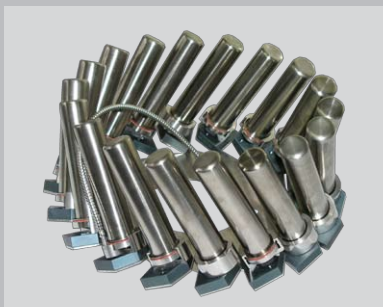
Disco con 18 vasos de 100ml con o sin dosificación